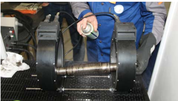
Рис. 8. Выполнение задания по магнитному контролю

ООО «АЗ ИНЖИНИРИНГ» (ВИК), ООО ТК «ТАСМА» (РК) и ЗАО «НИИИИ МНПО «Спектр» (МК). Учитывая, что конкурсанты могли быть не знакомы с особенностями применения оборудования конкретных производителей, для всех желающих были организованы онлайн-консультации. Вся необходимая конкурсантам информация для подготовки к финальному этапу доводилась до них в специально организованном онлайн-чате.