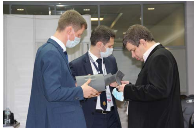
Рис. 9. Обсуждение апелляции членами жюри

Для наиболее малочисленной номинации по МК оказалось достаточным сформировать одно рабочее место. Задача финалистов состояла в проведении контроля одного и того же образца и определении с применением различных схем намагничивания участков с поверхностными дефектами (рис. 8).