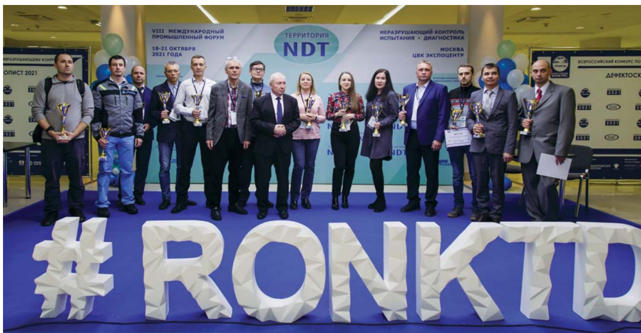
Рис. 10. Церемония награждения победителей и призеров конкурса «Дефектоскопист 2021»

са. Некоторые вопросы предполагали возможность многовариантного ответа. Для получения баллов за данные вопросы необходимо было выбрать все правильные ответы из числа предложенных. В личном кабинете конкурсанту также представлялся доступ к нормативным документам, необходимым для выполнения задания, и осуществлялся контроль времени, отводимого на выполнение заданий каждой из частей. Это позволило обеспечить прослеживаемость результатов и исключить человеческий фактор при подсчете итоговой оценки.