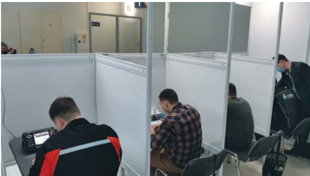
Рис. 6. Выполнение задания по ультразвуковому контролю