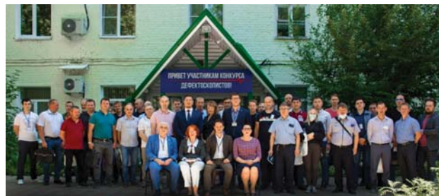
Рис. 1. Участники и члены жюри отборочного этапа в г. Казань

листов по различным методам НК. В результате задания, выполняемые конкурсантами в различных регионах, имели одинаковую сложность и требовали от участников демонстрации знаний технологии проведения НК, умений определения параметров контроля для различных элементов металлоконструкции, навыков выполнения контроля реального сварного соединения (рис. 2).