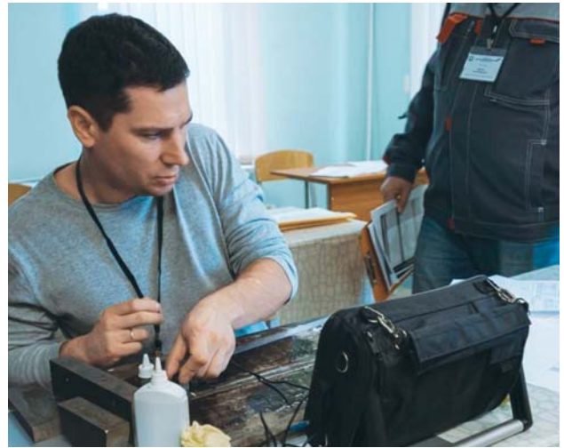
Рис. 2. Выполнение практического задания

ных конкурсантом при проведении НК и оформлении результатов. Данные из формуляров членов жюри заносились в автоматизированную систему, в которой проводился расчет оценки каждого участника, их ранжирование по занятым местам, оформление итогового протокола по номинации.