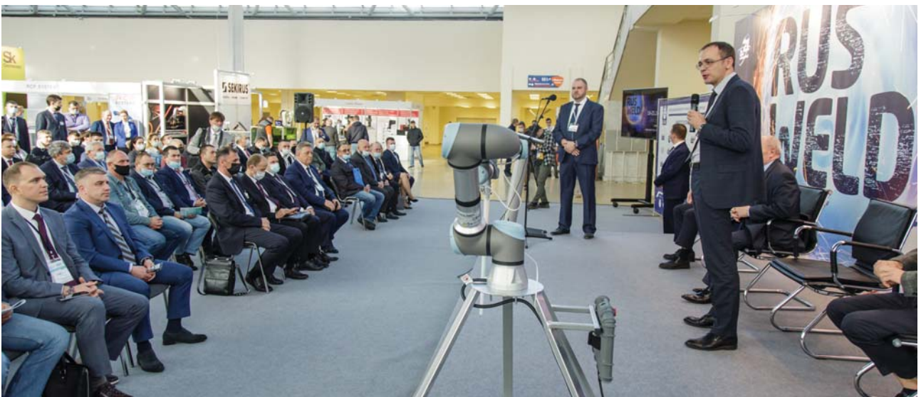
Рис. 4. Открытие финального этапа конкурса