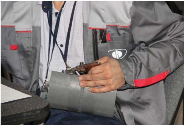
Рис. 5. Выполнение задания по визуальному и измерительному контролю